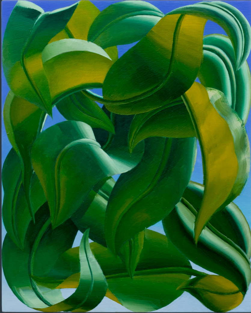
„Kleine Blätter“, 30 x 24 cm, Öl auf Holz, 2023