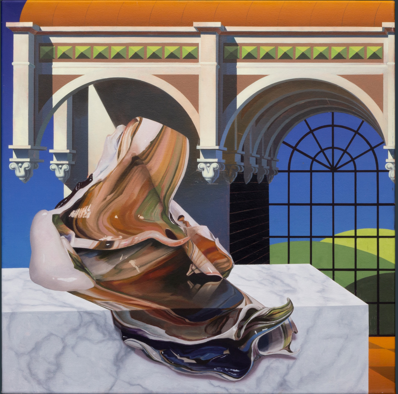
„Laziver Akt Mose“, 68 x 68 cm, Öl auf Leinwand, 2023