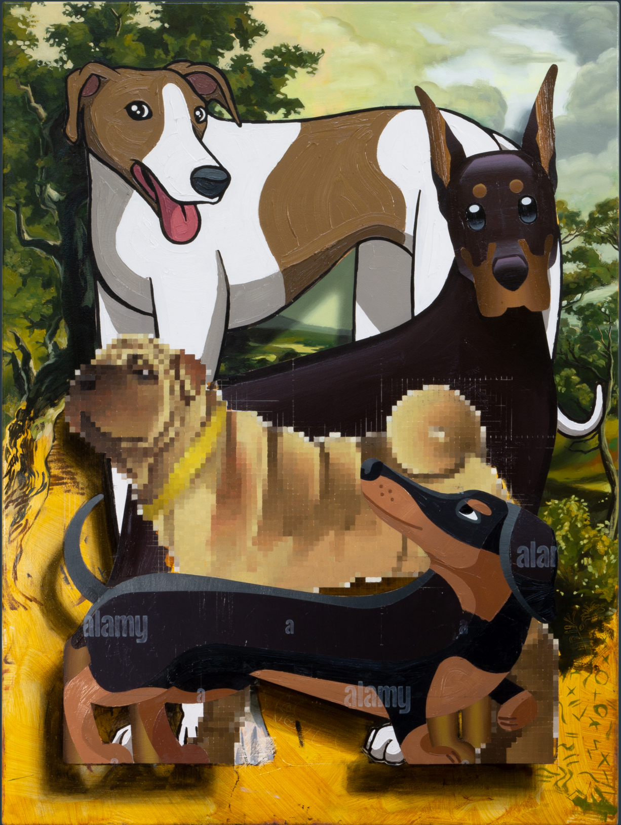
„Hunde“, 118 x 88 cm, Öl auf Leinwand, 2023