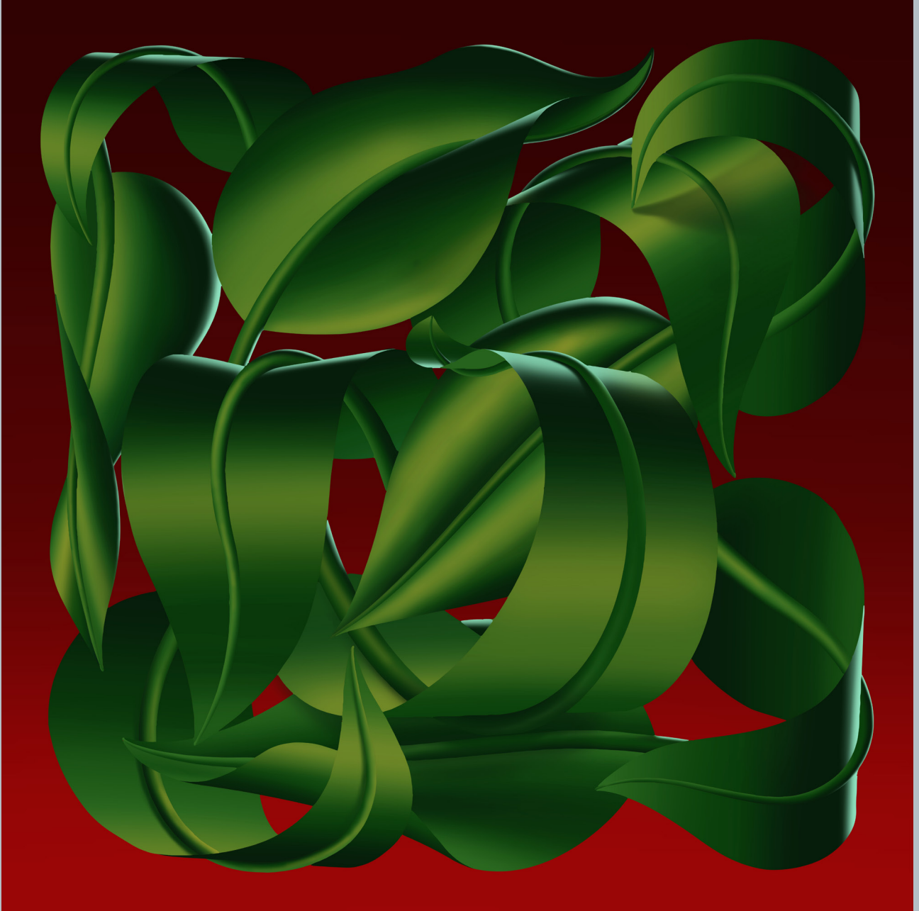
Ohne Titel, 5906×5906 px, digitale Malerei, 2023