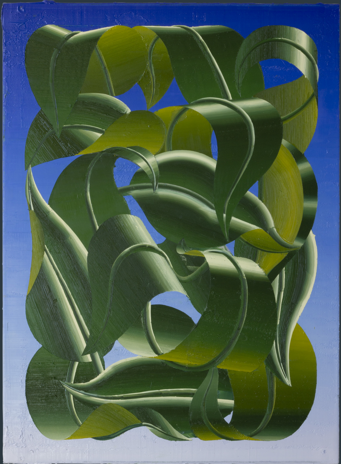
„Große Blätter“, 96 x 70 cm, Öl auf Leinwand, 2023