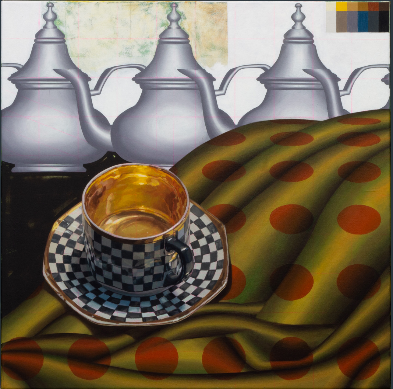
„Stoff und Punkt“, 68 x 68 cm, Öl auf Leinwand, 2023